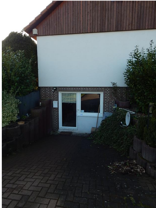
Terrasse EG rechts: