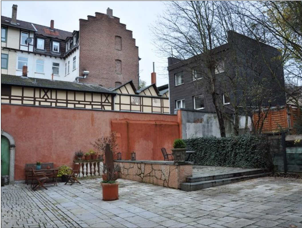
gemeinschaftlich genutzter Innenhof